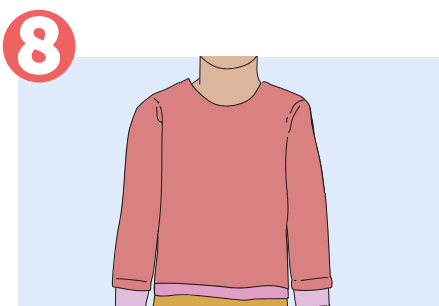
8 Läthni bieeyni tin koĶt jom bieeyni tin yĶc puĶny gatdu.