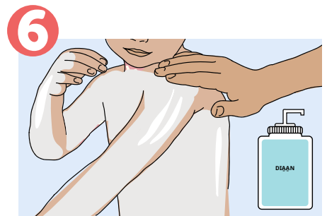
6 Dēe ji com bä en yöö deri diäan lath guäthni tin yĶc. Kä mi ε jen neme, läthni diäan puĶnydu keeliw amäni nhiam.