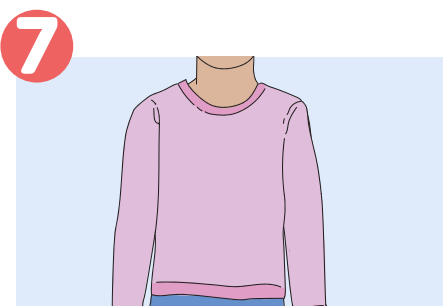
7 Läthni bieeyni tin yĶc puĶny gatdu.