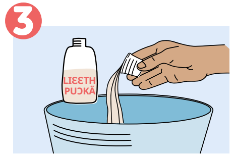
3 Mi görke je, läthni koth lieth puĶkä 1 mi thienj thjn.