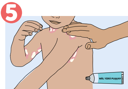
5 Mi ca je lar ε däk-tör, läthni diäan in la yierke puĶny ke kuj kä yöö be boĶr puäany yuĶth piny kie riäak guäthni diaal tin teke juey in la yär guĶp nath.