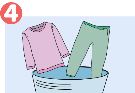
4 Läthni thurual kel ke ne gemith kel mi bär tetke rey yĶthä puĶkä.